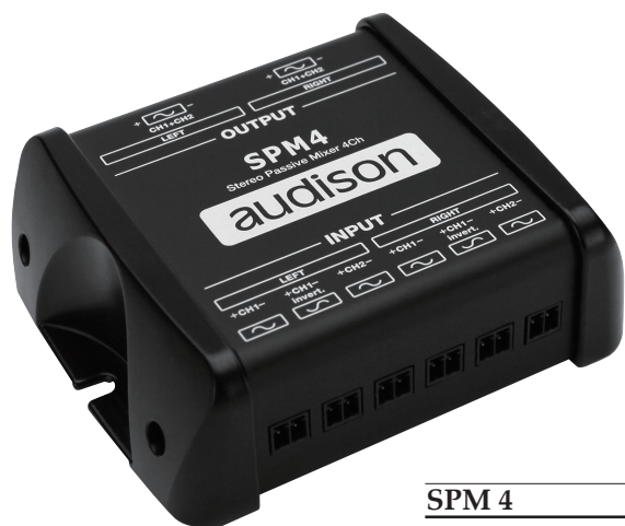
SPM 4 本体価格 ¥19,500/台

Audisonのデジタル・プロセッサまたはDSP内蔵アンプの入力数を増やしたいときに、このSPM4が有効になります。AudisonのプロセッサにはDe-Eq (EQのフラット化)機能が備わっているため、あらかじめフィルターのかかっている純正信号をミックスすることによって生じるノンリニアな音響特性を補正することができます。